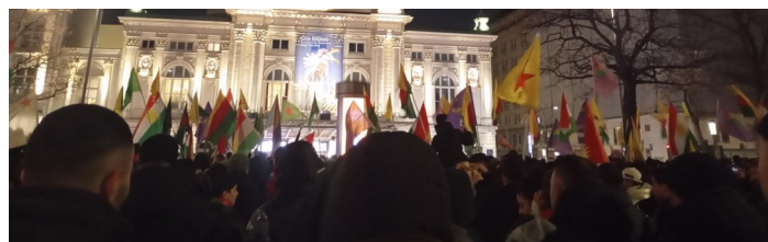
Solidarität mit Rojava, Hamburg, 8. 2. 2026

I m Januar gab es heftige Kämpfe der syrischen Armee gegen die kurdisch geprägte selbstverwaltete Region im Nordosten Syriens (Rojava). Große Teile wurden militärisch überrannt, ehe es am 30. Januar zu einem Abkommen kam, das die Integration in den syrischen Zentralstaat regeln soll. Geht damit ein ungewöhnliches 14-jähriges Experiment zu Ende, das für viele Linke zum Symbol der Hoffnung auf Befreiung geworden ist?