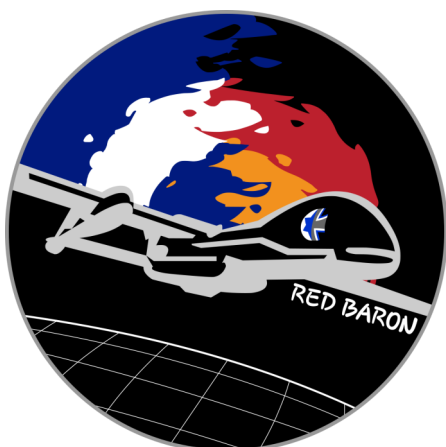
Verbandsabzeichen der israelisch-deutschen Heron-TP-Ausbildungsstaffel Red Baron – via Wikipedia Matankic / IDF

Dieser neue Cyber- und Sicherheitspakt ist nur die Fortsetzung länger bestehender militärischer Beziehungen zwischen Deutschland und Israel. Der Vertrag zur Lieferung von Arrow 3 wurde erst Mitte Dezember erweitert und hat jetzt ein Volumen von 6,5 Milliarden. Das ist der