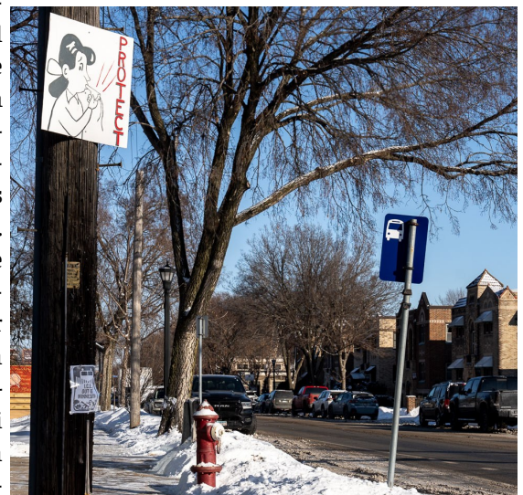
„Protect“ (Schützt) – Trillerpfeifen werden benutzt um davor zu warnen, dass ICE in der Nähe ist, 2. 2. 2026

ICE genießt dabei Sonderrechte, wie dass sie ihre Fahrzeuge nicht kennzeichnen müssen, Zugriff auf Militärausstattung haben und in Zivil agieren können. Trump erhöhte nun die Zahl an Beamten:innen um 10.000, wobei er neue Rekrut:innen vor allem mit ökonomischen Anreizen, wie dem Erlass der Studiengebühren, lockt. Dadurch ist ICE inzwischen die größte und finanzstärkste Polizeibehörde des Ministeriums für innere Sicherheit geworden (noch vor CIA und FBI). Ein Repressionsapparat also, der die Polizei nicht nur ergänzt, sondern auch mehr Befugnisse hat und nur direkt der Bundesregierung unterstellt ist.